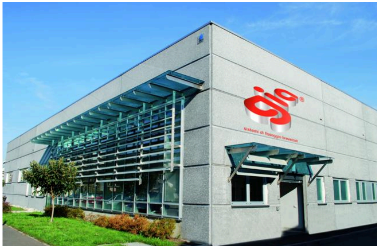
Il gruppo Gia